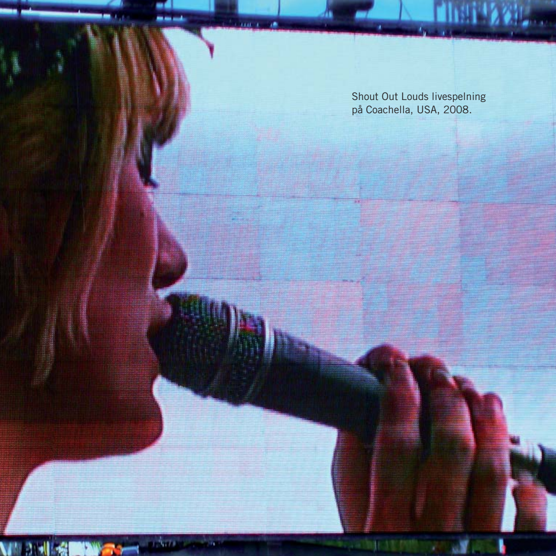
Shout Out Louds livespelning på Coachella, USA, 2008.